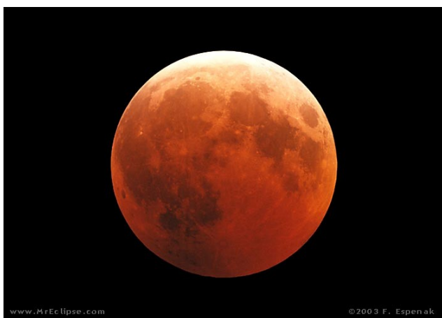
Figura 2: Imagem da Lua durante o eclipse de 09 de janeiro de 2001.

Os eclipses lunares só ocorrem na Lua Cheia, pois só nesta fase ocorre o alinhamento acima referido. Entretanto, na maioria das Luas Cheias não há eclipse, porque o plano da órbita da Lua em torno da Terra não coincide exatamente com o plano da órbita da Terra em torno do Sol, mas formam entre si um ângulo de 5,2^\circ . Isso faz com que o alinhamento Sol-Terra-Lua, na maioria das Luas Cheias, não seja perfeito, não se produzindo, portanto, um eclipse.